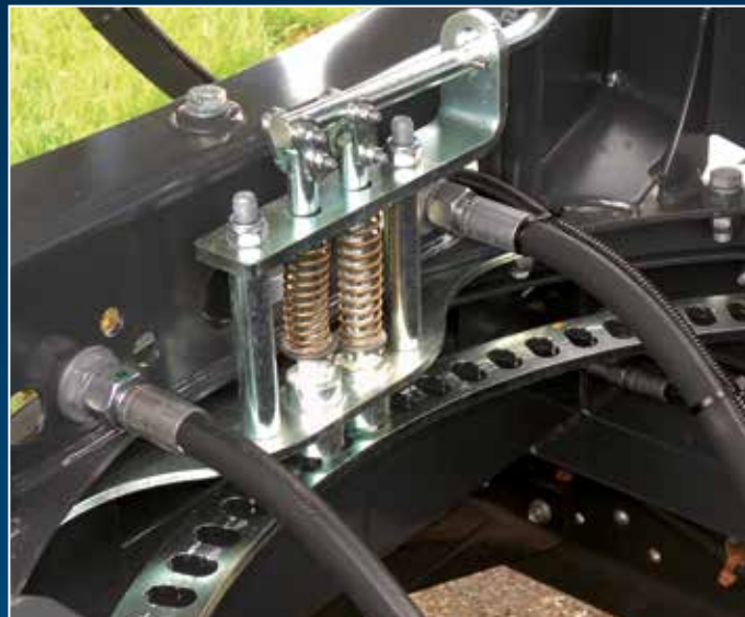
Stufenlos verstellbarer Drehkranz mit mechanisch lösbarer Sperre