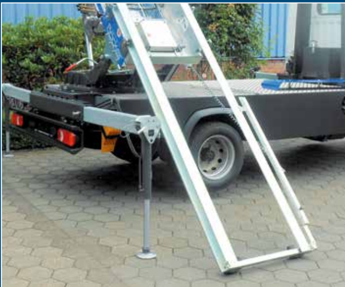
Bodentiefe Beladung möglich durch stufenlos ausziehbare untere Verlängerung