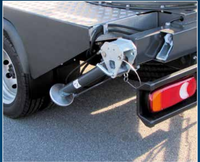
Hydraulische Stützen mechanisch ausziehbar und 60° schwenkbar