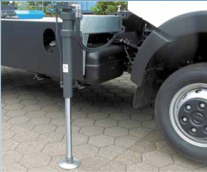
Hydraulische Stützen vorne optional ausziehbar