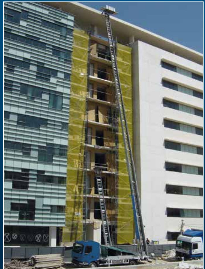
HL 42 auf 8 t LKW