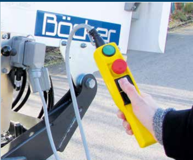
Bedienung unten über Bedienungstaster mit 4 m Kabel