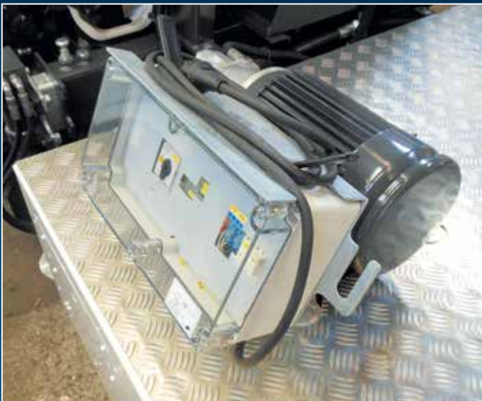
Zusätzlicher 230 Volt E-Motor (optional)