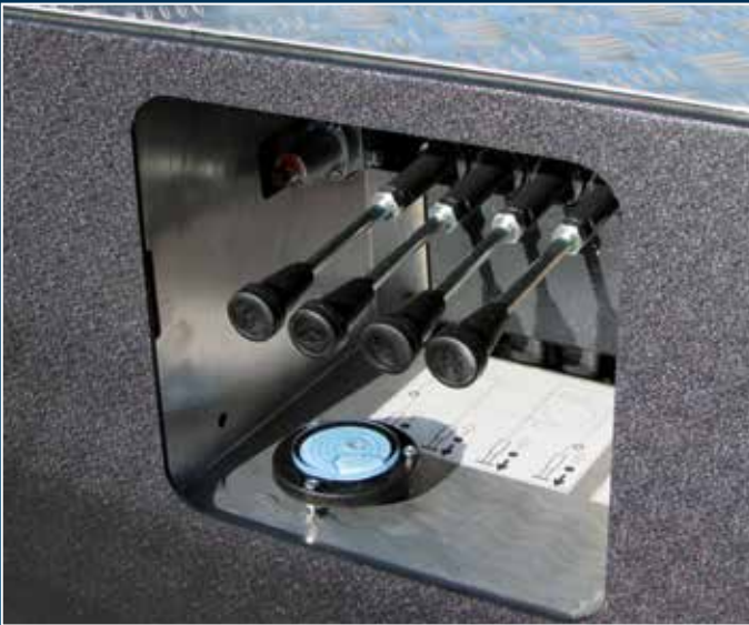
Steuerstand der hydraulischen Stützen