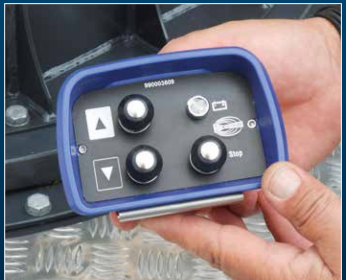
Optionale Bedienung unten über Funksteuerung