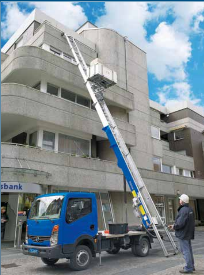
HL 26 auf 3,5 t LKW