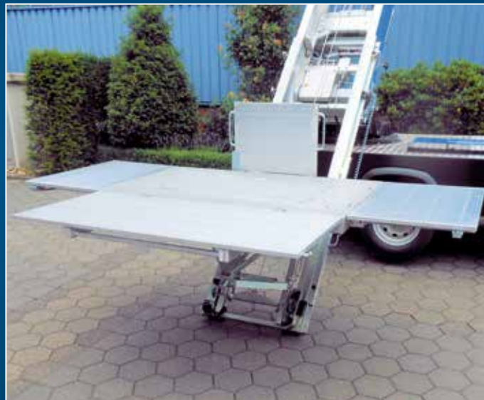
Große und ebene Beladefläche auf der Pritsche